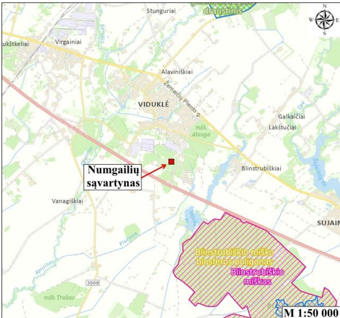
4.1 pav. Sąvartyno teritorijos apylinkių žemėlapis

Artimiausias paviršinis vandens telkinys yra bevardė kūdra, esanti už 130 m šiaurės vakarus nuo sąvartyno sklypo ribos. Vadovaujantis „Paviršinių vandens telkinių apsaugos zonų ir pakrančių apsaugos juostų nustatymo tvarkos aprašu“ teritorija nepatenka į paviršinio vandens telkinių apsaugos zonas ar pakrančių apsaugos juostas [9].